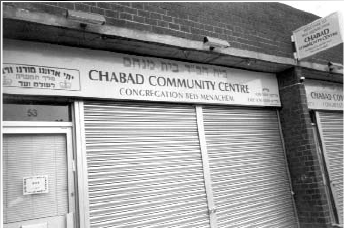
חזית בית הכנסת "בית מנחם"