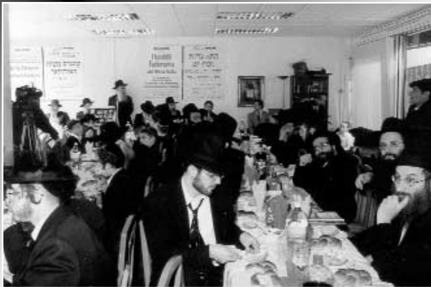
חלק מהקהל בקונגרס משיח האירופאי הראשון

בדי תמוז תשנ"ה נפטר ר' מענדל, ותקופה קצרה המשיך המניין להתקיים בבית הבן.