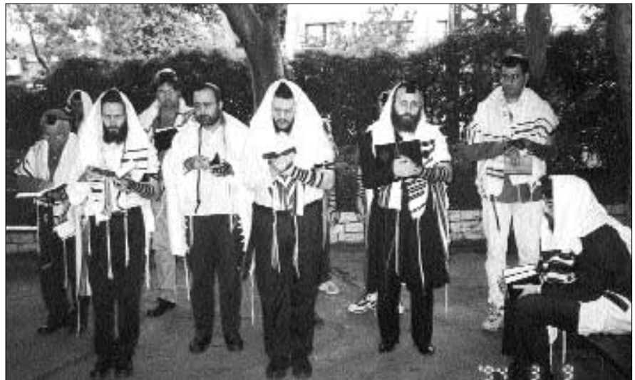
מנין חב"ד הקבוע מתפלל בגינה, לאחר שנזרק לפני שבועות אחדים מהמשכן הקבוע. כעת הוא חזר