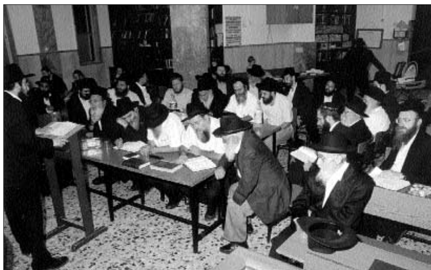
שיעור אחד מיני רבים בעניני גאולה ומשיח, המתקיים מידי שבוע בבית הכנסת "בית מנחם" בכפר חב"ד