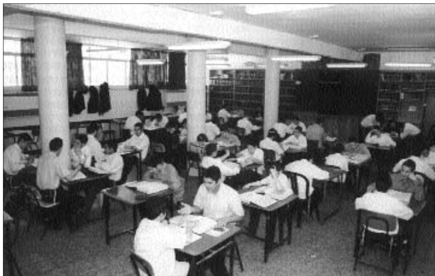
תלמידי "אחי תמימים" בעת לימודם