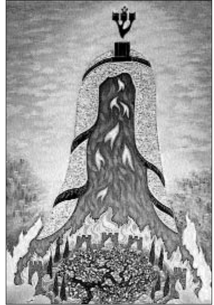
תמונה מתוך גלריית הגאולה

להקמת האתר. "ואכן, העבודה המאומצת עשתה פירות. בימים אלה הקמנו את האתר כאשר התצוגה הראשונה עוסקת בנושא משיח וגאולה! בגלריה הוירטואלית מופיעים עשרות ציורים של בית המקדש, אליהו מבשר הגאולה, שמחת הגאולה ועוד.